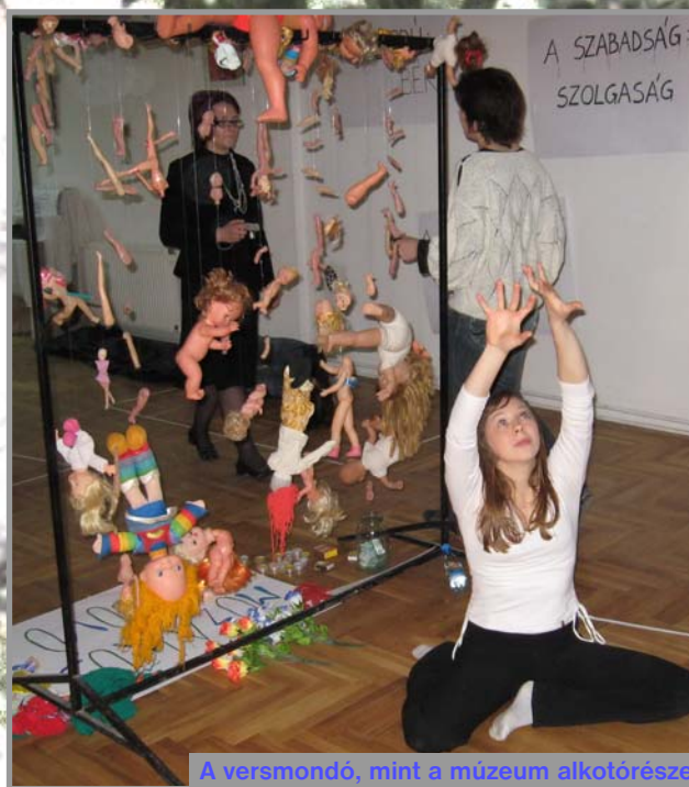
A versmondó, mint a múzeum alkotórésze