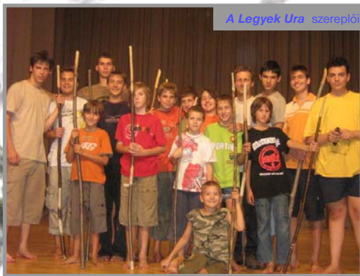
A Legyek Ura szereplői