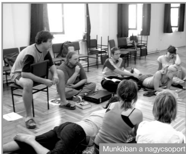
Munkában a nagycsoport