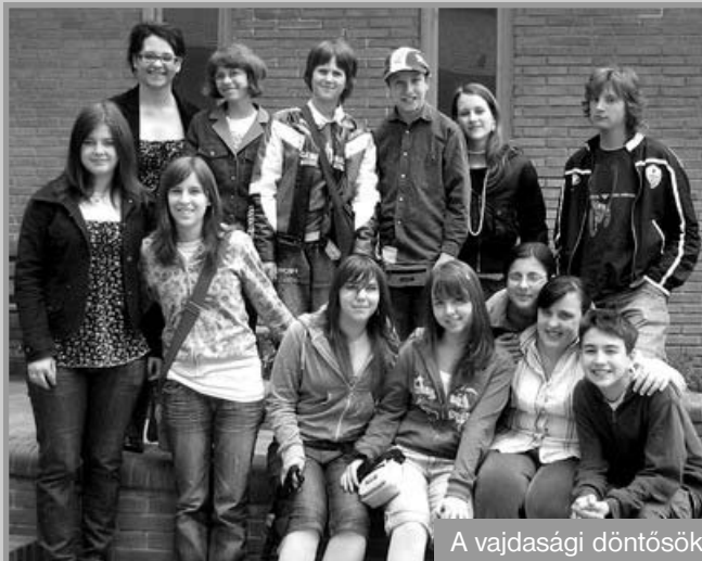
A vajdasági döntősök