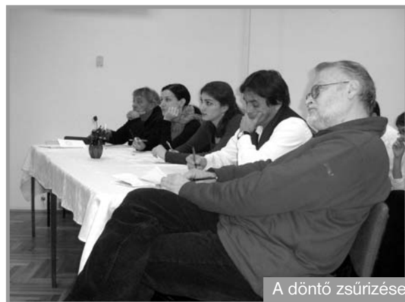
A döntő zsűrizése

A Vajdasági Magyar Versmondók Egyesülete és a bácsfeketehegyi Művelődési Egyesület 2008. október 25-26-án megszervezi a