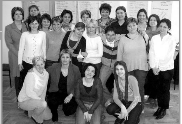
Az első pedagógusok, akik elvégezték „A drámapedagógia alapjai” képzést

- November 17-18., Bácsfeketehely, XI. Dudás Kálmán Nemzetközi Vers- és Prózamondó Találkozó (50 versenyző érkezett 3 országból,