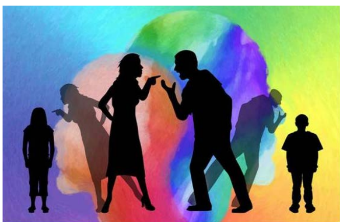
(Családi Magazin): A családi élet valószínűleg legnagyobb kihívása az elkerülhetetlenül adódó konfliktusok megoldása.

hogya a gyerek milyen ember lesz. Ha konfliktusokkal teli családban nő fel (szigorú, érzelemszegény, távolságtartó, elutasító szülői környezet, infantilis anya, függőségekben szenvedő apa), úgy dönthet, hogy az ellenszenv, a harag kifejezésre juttatása rossz dolog. Úgy dönthet, hogy mindig jónak, kedvesnek, vidámnak kell lenni, amivel lehetetlenné teszi a jogos érdekérvényesítését, gyakran nincs ereje kinyilvánítani negatívérzelmeit, arra törekszik, hogy a környezetet őt mindig jónak lássa. Miután felnő, a személyiségvonásai megmaradnak, ami őt a rák kialakulását elősegítő, illetve a rákot megengedő személyiséggé teszi. Környezetével minden áron igyekszik har-