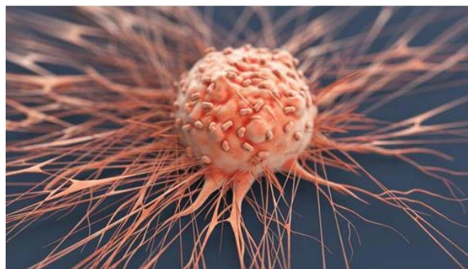
(EgészségKalauz): A rákbetegség közös jellemzője: a szabályozatlan sejt szaporulat, a szövetekbe való betörési képesség.

retne üzenni a testünk. Az összes testi probléma, a szerveinket érintő megbetegedések is feldolgozatlan lelki problémákra vezethetők vissza. A gyógyulás sem lehet a test és a lélek együttes kezelése nélkül. Ha a rákos megbetegedésre gondolunk, érdemes ezen elgondolkodni: Mindannyiunk testében, a számítások szerint, 200.000 rákos sejt van, ami elenyésző mennyiség a többi test-sejt számához viszonyítva. Ehhez még hozzá kell fűzni, hogy naponta hozzávetőleg 100 milliárdnyi sejtünk „születik újjá”, ennyi új sejt pótolja az elhaltakat. A bennünk levő ráksejtek eleve gyöngék, az egészséges testsejtekhez viszonyítva kevésbé tudnak szaporodni. Az ép és erős immunrendszer elég ahhoz, hogy a degenerált és rákos sejteket felismerje és elpusztítsa. Veszély akkor keletkezik, ha az egyén átmenetileg vagy folyamatosan valamely téren gátolja immunrendszerét. Ilyen gátlás lehet a hibás lelki magatartás: stressz, lelki megterhelés, elkeseredés, gyűlölet, harag, magány, mértéktelen szomorúság, depresszió, alkohol, kábítószer, stb. Tovább rontja az állapotot a helytelen táplálkozás, a bél mikrobiom állapota, elégtelen légzés, gócos gyuladások a szervezetben, stb. Vannak tehát olyan rákkeltő tényezők, melyek valamilyen hibás lelki magatartásban gyökereznek. Az ilyen magatartásnak is az oka a gyermekkorig nyúlik vissza, hisz attól függ,