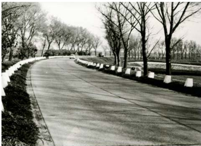
Nemzetközi út Feketicről Szenttamás felé 1960-as években

Hanem alighogy elkészült a nemzetközi, azaz III. Állami út, szinte hihetetlen, de 1939. január 19-én délelőtt 10 órától este 20 óráig meg lett tiltva mindenki