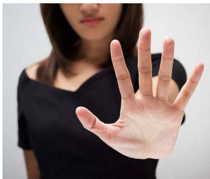
(Női Magazin): „Ha gyakrabban mondasz nemet másoknak, akkor igent mondasz saját magadnak.”