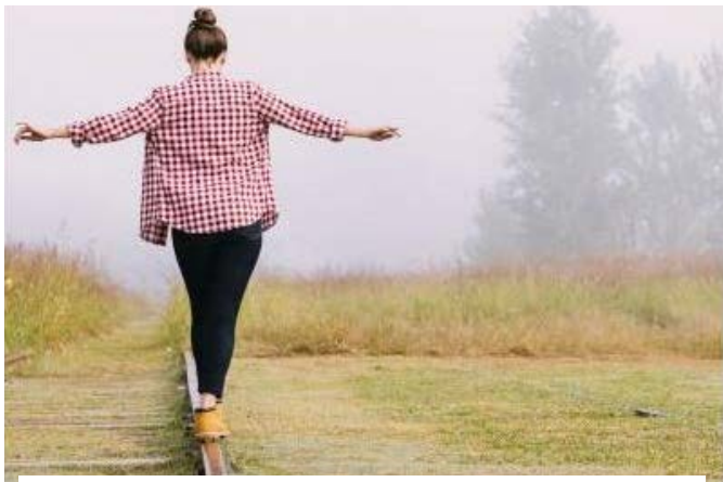
(Odaado.hu): Az elhízás egyfajta tünet: a test arra kényszeríti az egyént, hogy új utat keressen.

A táplálkozás már csecsemőkorban sem csupán alapvető szükséglet kielégítését jelenti, sokkal inkább az anyai szeretettség és gondoskodás fokmérője. Ez az összefüggés, többé-kevésbé, egész életünk során végig fennmarad. Később, ha az, az érzésünk támad, hogy nem szeretnek eléggé, vagy nem kapunk elegendő meghittséget, dicséretet, régi ösztönünk hatására többet eszünk, emlékezve a csecsemőkori meghitt közelség jóleső érzésére. Ezzel