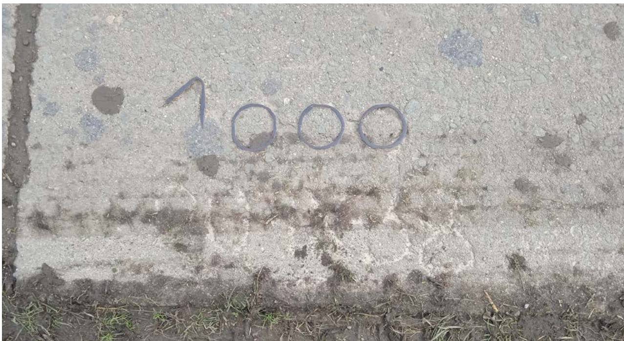
Az ezredik betontáblába beöntöttek fémmel egy 1000-es számot, jelenti: 10 km-re Szenttamástól (1000 drb x 10 m) és mint minden táblába, ebbe is belekarcolták az öntési dátumot: 20.IX.38.

Az út alapja először földtöltés volt. Tulajdonképpen az út menti 3 méter széles vízvezető árok kiásásával nyerték ki a földet. A földtöltésre előbb homok, majd apró kő került. Végül 2 sorban 3x10 méteres betonkockákat öntöttek ki 25 cm vastagságban. Betonvasat nem öntöttek bele. Így az út teljes szélessége 6 méter lett. Minden kockában az út nyugati oldalánál