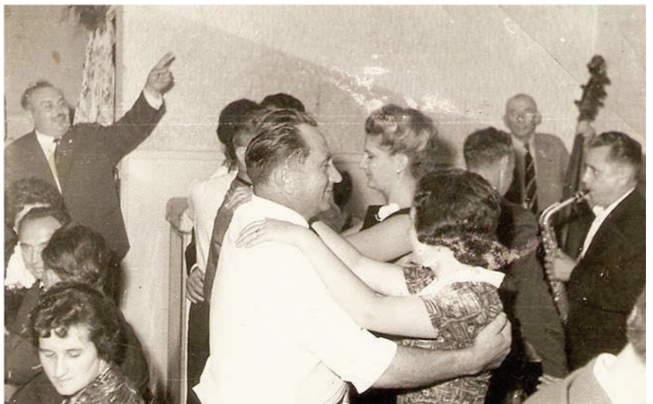
Bál a Bútor kocsmában