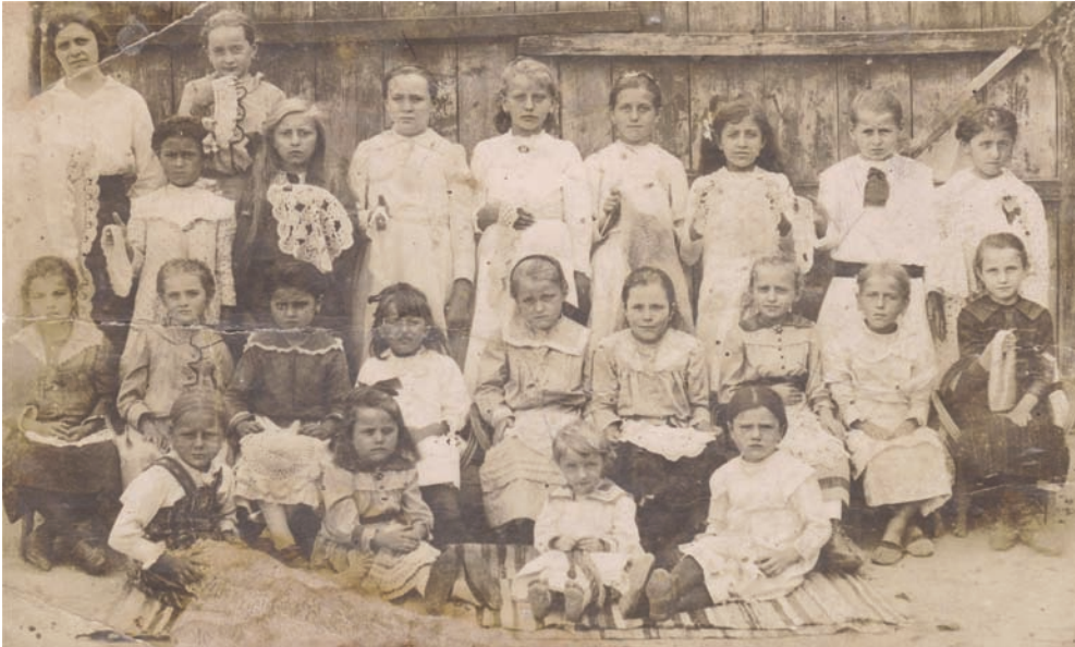
Kézimunkázó lányok 1918-ból