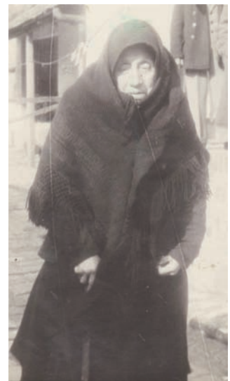
Öreg néni berliner kendőben