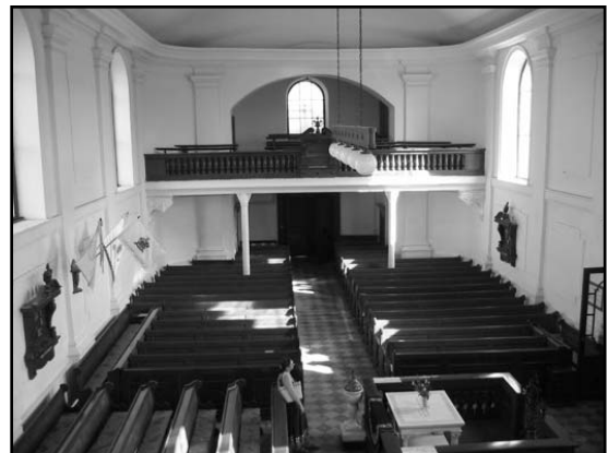
A bácsfeketehégyi Református templom belseje