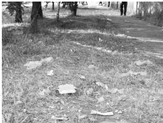
...és ezek is...