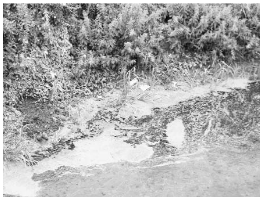
...és még ezek is.

tovább fokozzuk. Ahányszor átfúrjuk az ivóvíz-tartalékok elválasztó vízzáró réteget, annyi esélyt adunk az ivóvíz tartalékaink elszennyezésére. A házi kutak ugyanis nincsenek biztonságosan megvédve egy esetleges szennyeződéstől. Ne feledjük! A vízünk még mindig jobb, mint sok más községé. Arzénmentes. Ettől sokkal nagyobb gond az elavult vízhálózat. Felújítására csak akkor lesz némi remény, ha a gazdaság fellendül. A gazdaság pedig csak úgy lendül fel, ha azt mindenki akarja. A jelenlegi gazdasági helyzet nagyon hátrányos számunkra, de nem szabad feladni, és az örökös nyavalygás helyett dolgozni kell. Keményen dolgozni. Ahol lehet, fiatalítani. Az egész községre szinte minden szinten ráférne a fiatalítás, csak hogy ezt egyesek nem úgy értik, ahogy kellene. A fiatalokat hagyni kell dolgozni.