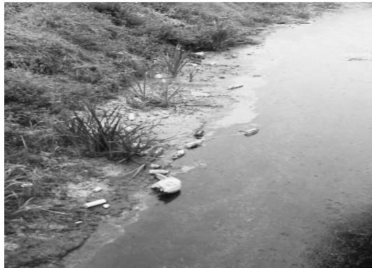
Ezek mi vagyunk...

Azzal, hogy ebben a zavaros világban összevissza mindenki, aki teheti észrevétlenül még kutakat fúrat a saját telkén, a gondokat nem oldjuk meg, csak